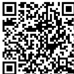
Destineo sur l'AppStore